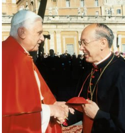
Cardenal Juan Luis Cipriani y S.S... Papa Bento