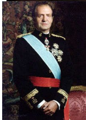
REY DE ESPAÑA