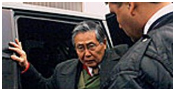
Fujimori being extradited to face human rights and corruption charges in Peru.

PEDRO HUILCA secretario general de la CGTP , FUE ASESINADO diciembre 18 1992 por el GRUPO COLINA (Escuadrón de la muerte) bajo directriz del SIN (servicio de inteligencia nacional) y del Presidente A Fujimori que alega no "SABIA NADA".