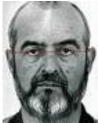
VLADIMIRO MONTESINOS TORRES